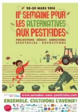
L'affiche - 2016